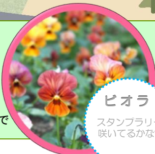
ピオラ スタンプラリー 咲いてるかな?

スタンプは、『はっぱマーク』のところにあります。 ★プレゼントの交換は、入園ゲートにて16:00まで