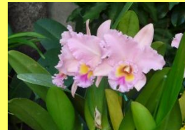
学名: Cattleya 科名: ラン