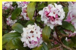
学名: Daphne odora 科名: シンチョウゲ

甘い香りですが、樹液が肌につくと炎症を起こす可能性がある等、取り扱いには注意が必要です。