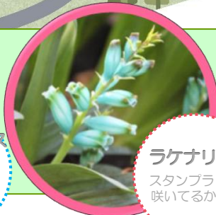
ラケナリア スタンプラリー 咲いてるかな?