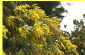
学名: Acacia baileyana 科名: マメ

「ミモザ」と親しまれ、香りのある小さな黄色いボンボンのような花をたくさんつけます。