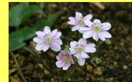
学名: Hepatica nobilis var. japonica f. magna 科名: キンボウゲ