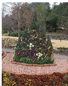
フラワーキャッスル 場所: 装飾花壇