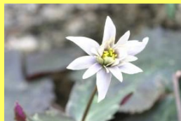
学名: Anemone keiskeana 科名: キンボウゲ