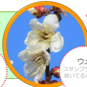
ウメ スタンプラリー 咲いてるかな?