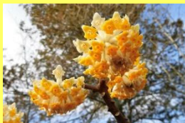
学名: Edgeworthia chrysantha 科名: シンチョウゲ