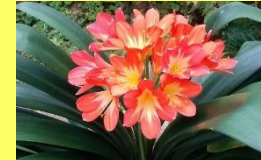
学名: Clivia miniata 科名: ヒガンバナ

花はもちろんです、葉も肉厚で美しいため、花のない時期にも観葉植物として楽しめます。