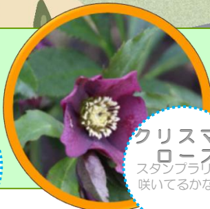
クリスマスローズ スタンプラリー 咲いてるかな?