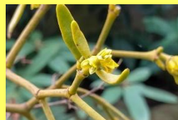
学名: Viscum album 科名: ビャクダン

寄生植物で、実の果肉には粘り気があり、種子は実が食べられったり、排泄される過程で宿主の樹皮に付着します。