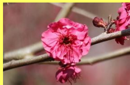
学名: Armeniaca mume 科名: バラ

梅園では約90品種、240本のウメをあたたかいコタツに入ってお楽しみいただけます。