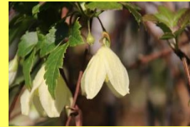
学名: Clematis cirrhosa 科名: キンボウゲ