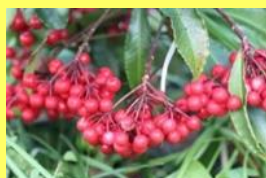
学名: Ardisia crenata 科名: サクラソウ