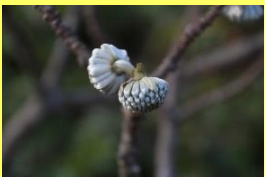
学名: Edgeworthian chrysantha 科名: シンチョウゲ

枝が3つに分枝し、これがミ ツマタの名前の由来です。小 さな花芽が集まっています。