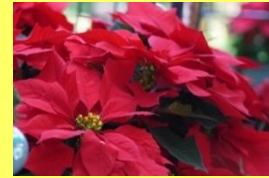
学名: Euphorbia pulcherrima 科名: トウダイグサ

クリスマスの雰囲気満点。赤色 に色づいた部分は苞(ほう)と 呼ばれるもので、花は苞の中心 にある黄色い部分です。