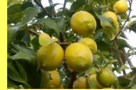
学名: Citrus limon 科名: ミカン

果実売り場ではお馴染みの黄色 い果実が、大きな木に鈴生り になっている姿は、なかなかお目 にかかれません。