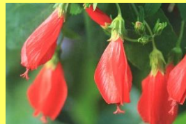
学名: Hibiscus sp. 科名: アオイ

花びらを閉じたまま、うなずく ように下を向いて咲きます。ス リーピング・ハイビスカスとも 呼ばれています。