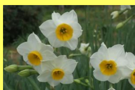
学名: Narcissus 科名: ヒガンバナ

スイセンの仲間、イペリア 半島を中心に地中海沿岸地域 に25~30種類が自生してい ます。