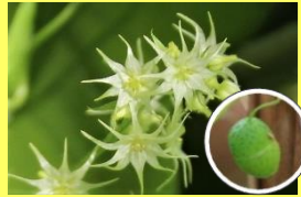
学名: Actinostemma tenerum 科名: ウリ

星形の花が満開ですが、小さいので見過ごされがちです。花の後はは緑色の実がなります。