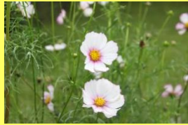
学名: Cosmos bipinnatus 科名: キク

日が短くなると花芽をつける短日植物ですが、近年、日の長さに影響されない早生品種なども栽培されています。