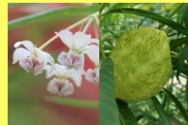
学名: Gomphocarpus fruticosus 科名: キョウチクトウ

シャンデリアのような可憐な花から、どこをどうすれば、こんな風船のような実ができるのか!? とても個性的な植物です。