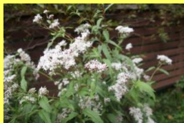
学名: Eupatorium japonicum 科名: キク

かつては川の土手等に多く自生し、秋の七草の一つとして古くから親しまれてきました。