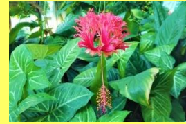
学名: Hibiscus schizopetalus 科名: アオイ

花は風鈴のようにぶら下がり咲きます。可愛らしい姿が特徴のハイビスカスの仲間です。