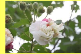
学名: Hibiscus mutabilis 科名: アオイ

漢字では「酔芙蓉」と書き、花色が朝から夕方にかけて白から桃色へ変化する様子を酔って赤くなる様に例えています。