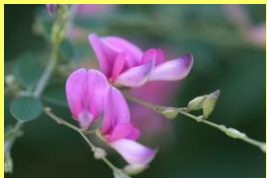
学名: Lespedeza thunbergii 科名: マメ

秋の七草の一つ。『万葉集』に最も多く詠まれた植物。古くから日本人に親しまれています。