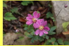
学名: Anemone hupehensis 科名: キンボウゲ

中国原産ですが、京都・貴船神社周辺に多数野生化しています。別名を貴船菊といいます。