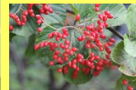
学名: Viburnum dilatatum 科名: レンブクソウ