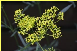
学名: Patrinia scabiosifolia 科名: スイカズラ