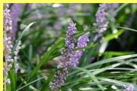
学名: Liriope muscari 科名: キジカクシ