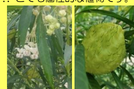
学名: Gomphocarpus fruticosus 科名: キョウチクトウ

シャンデリアのような可憐な花から、どこをどうすれば、こんな風船のような実ができるのか!? とても個性的な植物です。