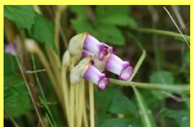
学名: Aeginetia indica 科名: ハマウツボ