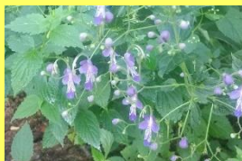
学名: Tripura divaricata 科名: シソ

鳥の「雁」から名前が付いたという個性的な形の可愛い花ですが、葉や茎は異臭を放ちます。