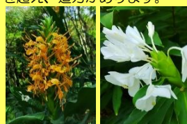
学名: Hedychium 科名: ショウガ

江戸時代、薬用植物として渡来し、現在は主に鑑賞用として栽培されます。高さはときに3mを超え、迫力があります。