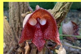
学名: Aristolochia salvadorensis 科名: ウマノスズクサ