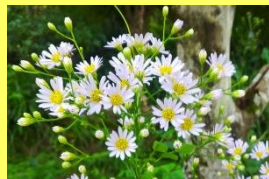
学名: Aster tataricus 科名: キク