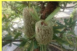
学名: Banksia 科名: ヤマモガシ

近年カッコいい！オシャレ！と人気のオーストラリア原産の植物。タワシのような花も個性的です。