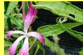
学名: Ipomoea nil 科名: ヒルガオ