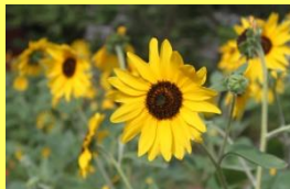
学名: Helianthus 科名: キク