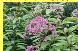
学名: Eupatorium purpureum 科名: キク

秋の七草「フジバカマ」の仲間です。草丈は2mにもなり、小花が無数に集まる雄大な花穂には沢山の蝶がやってきます。