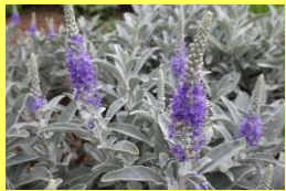
学名: Veronica ornata 科名: オオバコ

花の瑠璃色を中国の洞庭湖(トウテイコ)の美しい水の色にたとえて名付けられました。