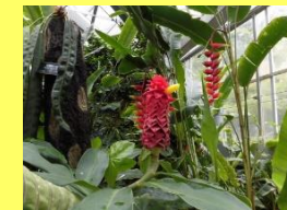
学名: Costus comosus 科名: オオホザキアヤメ