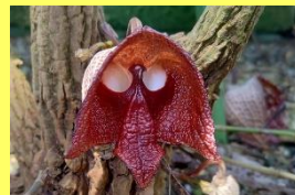
学名: Aristolochia salvadorensis 科名: ウマノスズクサ