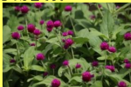
学名: Gomphrena 科名: ヒユ

暑さや乾燥につよく日本の夏に適した植物です。紫・ピンク・白色など丸く色ついているのは苞です。