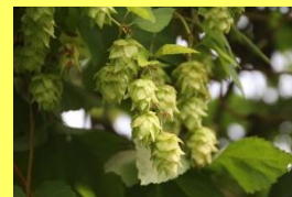
学名: Humulus lupulus 科名: アサ