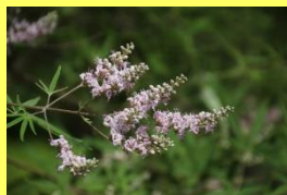
学名: Vitex agnus-castus 科名: シソ