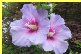
学名: Hibiscus syriacus 科名: アオイ

中国原産ですが、日本では古くから栽培され、その美しさから江戸時代には流行したことがあるそうです。