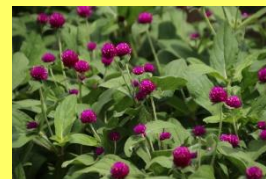
学名: Gomphrena 科名: ヒユ

暑さや乾燥につよく日本の夏に適した植物です。紫・ピンク・白色など丸く色ついているのは苞です。