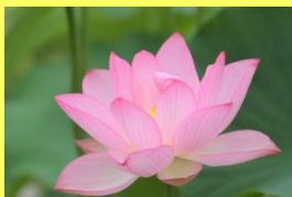
学名: Nelumbo nucifera 科名: ハス

花は早朝に開き、午後にはほとんど閉じます。ポツポツ咲き始め、盛夏到来を知らせてくれています。