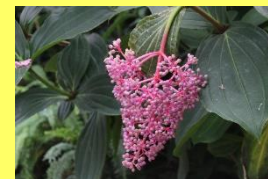
学名: Medinilla speciosa 科名: ノボタン

インドネシア原産の落葉低木で英名は「Showy Asian grapes(綺麗なアジアのブドウ)」といわれます。