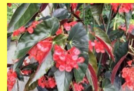
学名: Begonia 科名: シュウカイドウ