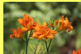
学名: Hemerocallis 科名: ワスレグサ