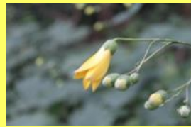
学名: Kirengeshoma palmata 科名: アジサイ