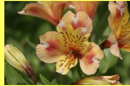
学名: Alstroemeria 科名: ユリスイセン