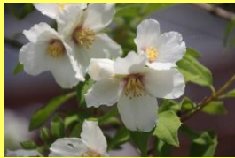
学名: Philadelphus 科名: アジサイ