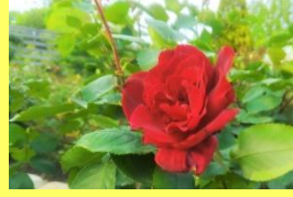
学名: Rosa 科名: バラ