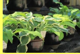
学名: Hosta 科名: キジカクシ