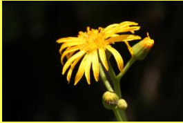
学名: Ligularia japonica 科名: キク

山地林内や林縁のやや湿ったところにはえる多年草で、草丈は60~100cm程に生長します。