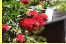
学名: Callistemon speciosus 科名: フトモモ

オーストラリアからニューカレドニアに分布します。花はピンを洗うためのブラシに似ています。