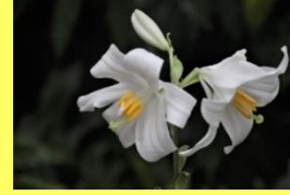
学名: Lilium candidum 科名: ユリ