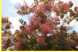
学名: Cotinus coggygria 科名: ウルシ

雌雄異株の落葉樹で雌木の枝先につく花序は遠くからは煙がくすぶっているように見えます。