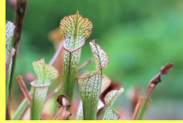
学名: Sarracenia 科名: サラセニア