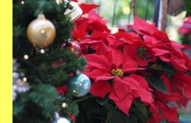
学名: Euphorbia pulcherrima 科名: トウダイグサ

クリスマスの時期の鉢物としてお馴染みですが、実は寒さには弱いので室内で管理します。