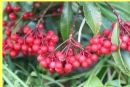
学名: Ardisia crenata 科名: サクラソウ