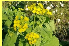
学名: Brassica rapa 科名: アブラナ