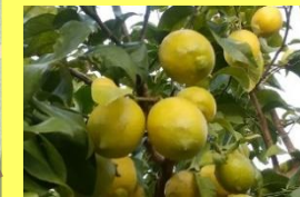
学名: Citrus limon 科名: ミカン

青果売り場ではお馴染みですが、大きな木に鈴生りになっている姿は、なかなか見られないかも？