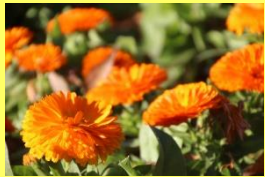
学名: Calendula 科名: キク