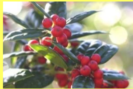
学名: Ilex cornuta 科名: モチノキ

若い枝や若い木にはヒイラギのようにトゲトゲの葉をつけますが、古い木は丸みのある葉を多くつけます。