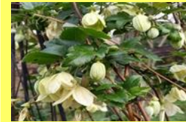
学名: Clematis cirrhosa 科名: キンボウゲ