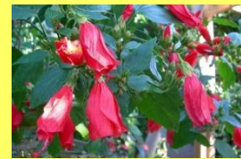
学名: Hibiscus sp. 科名: アオイ

花びらを閉じたまま、うなずくように下を向いて咲くことからスリーピング・ハイビスカスとも呼ばれています。