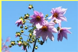
学名: Dahlia imperialis 科名: キク