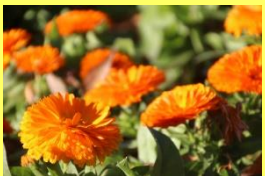
学名: Calendula 科名: キク