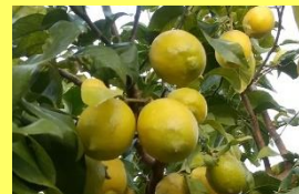
学名: Citrus limon 科名: ミカン

果物売り場ではお馴染みですが、大きな木に鈴生りになっている姿は、なかなか見られないかも?