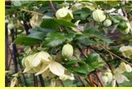
学名: Clematis cirrhosa 科名: キンボウゲ