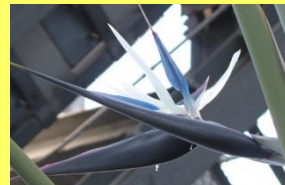
学名: Strelitzia nicolai 科名: コクラクチョウカ