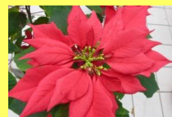
学名: Euphorbia pulcherrima 科名: トウダイグサ

クリスマスの時期の鉢物としてお馴染みですが、実は寒さには弱いので室内で管理します。