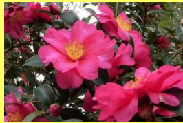
学名: Camellia sasanqua 科名: ツバキ