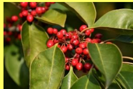
学名: Ilex rotunda 科名: モチノキ