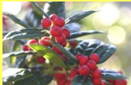
学名: Ilex cornuta 科名: モチノキ

若い枝や若い木はヒイラギのようにトゲトゲの葉をつけますが、古い木は丸みのある葉を多くつけます。