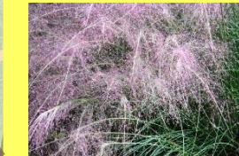
学名: Muhlenbergia capillaris 科名: イネ