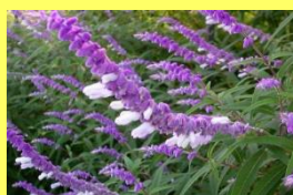
学名: Salvia leucantha 科名: シソ

美しい紫色やピロードのような手触りから、アメジストセージやバルベットセージとも呼ばれます。