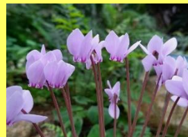
学名: Cyclamen 科名: サクラソウ