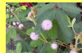
学名: Mimosa pudica 科名: マメ