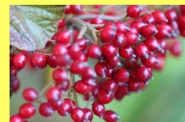
学名: Viburnum dilatatum 科名: レンブクソウ