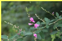
学名: Lespedeza thunbergii 科名: マメ

秋の七草の一つ。『万葉集』に最も多く詠まれた植物。古くから日本人に親しまれてきました。