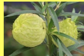
学名: Gomphocarpus fruticosus 科名: キョウチクトウ