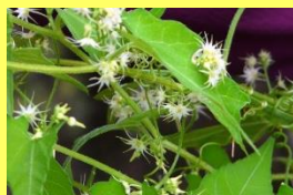
学名: Actinostemma tenerum 科名: ウリ