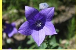
学名: Platycodon grandiflorus 科名: キキョウ