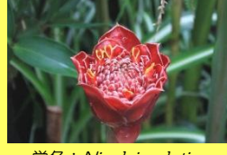
学名: Nicolaia elatior 科名: ショウガ

花茎の先に花が集まって咲くようすがトーチ(たいまつ)のように見えることからこの名があります。