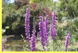
学名: Lythrum anceps 科名: ミソハギ