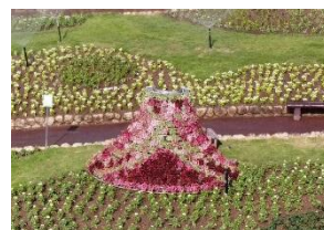
#フラワードレス #初夏の衣替え 場所: 装飾花壇