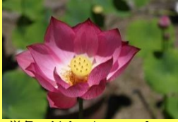
学名: Nelumbo nucifera 科名: ハス