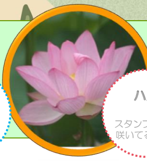
ハス スタンプラリー 咲いてるかな?