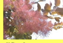
学名: Cotinus coggygria 科名: ウルシ