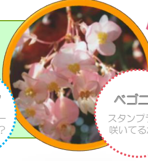
ベゴニア スタンプラリー 咲いてるかな?