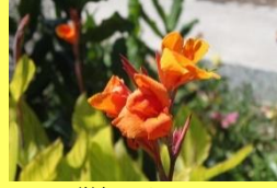
学名: Canna 科名: カンナ