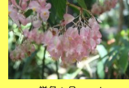
学名: Begonia 科名: シュウカイドウ