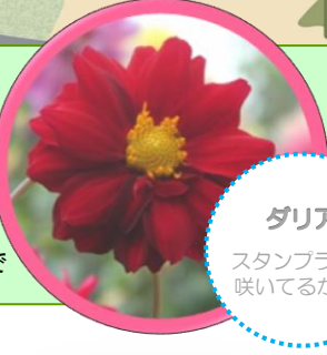
ダリア スタンプラリー 咲いてるかな?

スタンプは、『はっぱマーク』のところにあるよ。 ★プレゼントの交換は、入園ゲートにて16:00まで