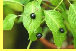
学名: Helwingia japonica 科名: ハナイカダ