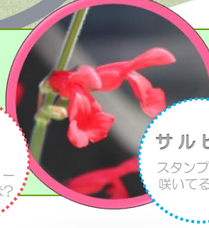
サルビア スタンプラリー 咲いてるかな?