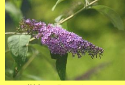
学名: Buddleja 科名: ゴマノハグサ