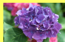
学名: Hydrangea 科名: アジサイ