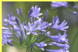
学名: Agapanthus 科名: ムラサキクンシラン