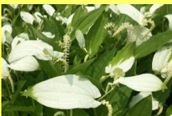
学名: Saururus chinensis 科名: ドクダミ

花の時期になると葉が白く色づき、蒸し暑い梅雨の季節に水辺で涼しげな姿を見せてくれます。