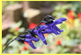
学名: Salvia guaranitica 科名: シソ