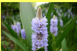
学名: Pontederia cordata 科名: ミズアオイ