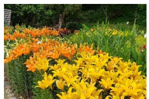
#ユリ #花のある暮らし #flowerstagram 場所: 球根園