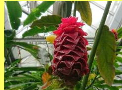
学名: Costus comosus 科名: オオホザキアヤメ