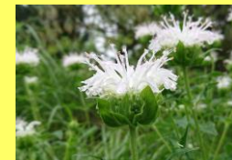
学名: Monarda fistulosa 科名: シソ