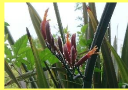
学名: Phormium tenax 科名: ワスレグサ