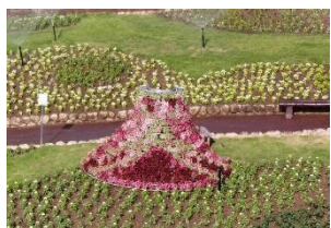
#フラワードレス #初夏の衣替え 場所: 装飾花壇