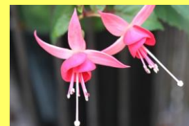
学名: Fuchsia 科名: アカバナ