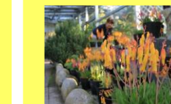
学名：Lachenalia 科名：キジカクシ