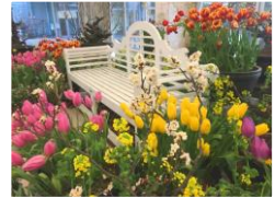
#クリスマスローズ #春の草花 #盆梅 場所：イベントホール