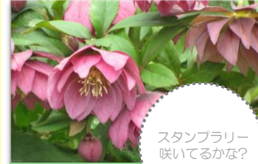
クリスマスローズ