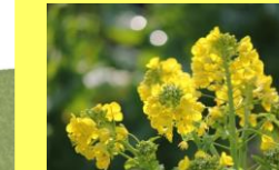
学名：Brassica napus 科名：アブラナ