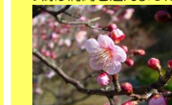
学名：Prunus mume 科名：バラ