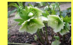
学名：Helleborus orientalis 科名：キンポウゲ