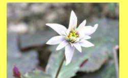
学名：Anemone keiskeana 科名：キンポウゲ