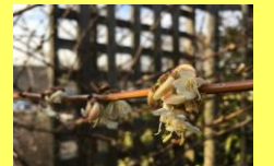
学名：Lonicera fragrantissima 科名：スイカズラ 品種：フラグランティッシマ