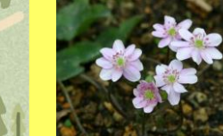
学名：Hepatica nobilis var. japonica f. magna 科名：キンポウゲ